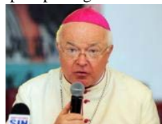
Caso Wesolowski, l'Onu aveva chiesto una punizione