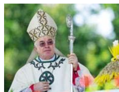
Wesolowski, abusi e possesso di materiale pedopornografico