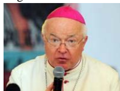
Pedofilia, arrestato l'ex nunzio di Santo Domingo in Vaticano