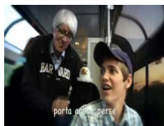
Land of Variety (Land of Hope and Dreams)