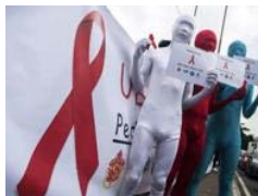
Aids, Fear must not win