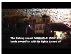
Illegal driftnet fisheries, while Italy denies it