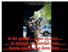
Seven Arrests in Milan Expo Scandal