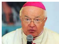
Le missioni all'estero del vescovo per organizzare festini con