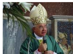
Pedofilia, l'ex vescovo Wesolowski ricoverato in ospedale: